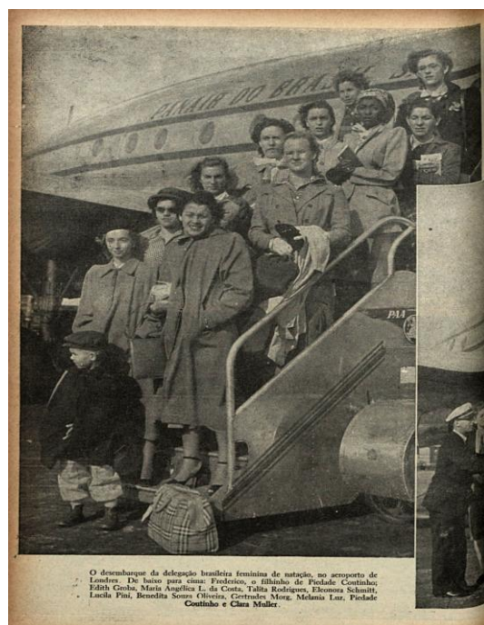
Figura 1 – A primeira delegação olímpica brasileira feminina de atletismo – Londres 1948.